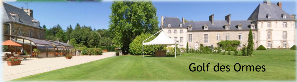
Golf des Ormes