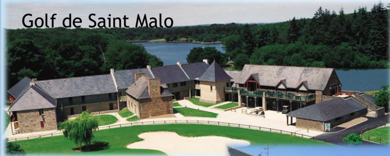
Golf de Saint Malo

13 ème édition de ce Championnat et 8 ème sur les 2 sites.